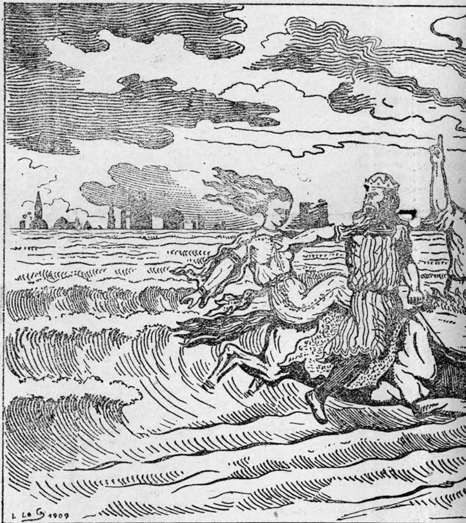
A. LAJAT, Moutier, Montroulez.

Braz ive ar burz andret ar beler rouchoudou. Ar vinoret dilez war ar môr bras darn all en disesp gant garante ha